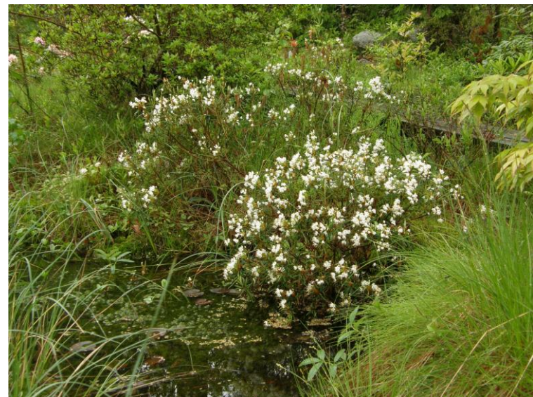
Suopursuja puutarhassa lammen rannalla.

Pistokaslisääminen on vähän vaativampaa, mutta sekin onnistuu, kun pistokkaan ottaa kesällä osin puutuneesta uudesta versosta.