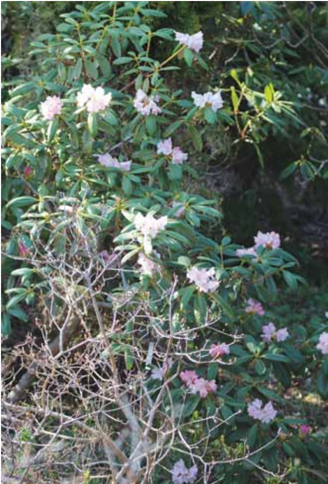
R. principis alppiruusun kukintaa Kustavissa. Etualalla on R. mucronulatum cw, Cheju, kääpiöivä koreanalppiruusu Koreasta.

Kasvitieteilijänä ansioitunut Orléansin prinssi Henri (1867–1901) oli Ranskan syrjäytetyn kuningassuvun Englannissa syntynyt jälkeläinen, joka saavutti kuuluisuutta useilla tutkimusmatkoillaan Aasiassa ja Afrikassa. Hän kuoli Saigonissa vain 33-vuotiaana Assamiin tehdyn retken jälkeen. Matkan "ammattimaisin" jäsen Gabriel Bonvalot (1853–1933) teki tutkimusmatkoja Ranskan valtion laskuun mm. Venäjällä, Kiinassa ja Afrikassa ja vaikutti Ranskan politiikassa kolonialistien riveissä.