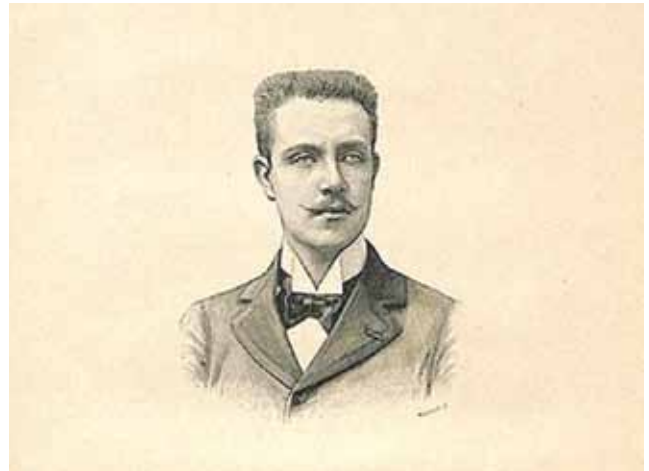
Orleansin prinssi Henri